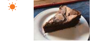
自家製ガトーショコラ 250円