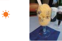
自家製ラムレーズンアイス 500円