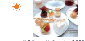
旬のスイーツプレート 3,200円～