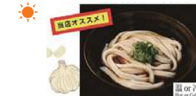
直島限定!アホうどん