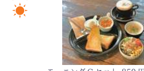
モーニングCセット 850円

営 8:00～16:00(L.O.フード 15:00 L.O.ドリンク 15:30)