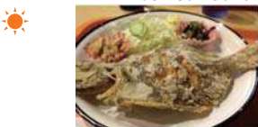
ヒラメ唐揚げ定食 1,500円