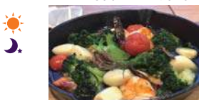
瀬戸内のアヒージョ 600円～