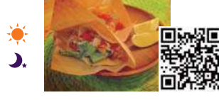
タコス 1p 400円、4p 1,000円