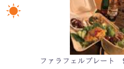
ファラフェルプレート 980円